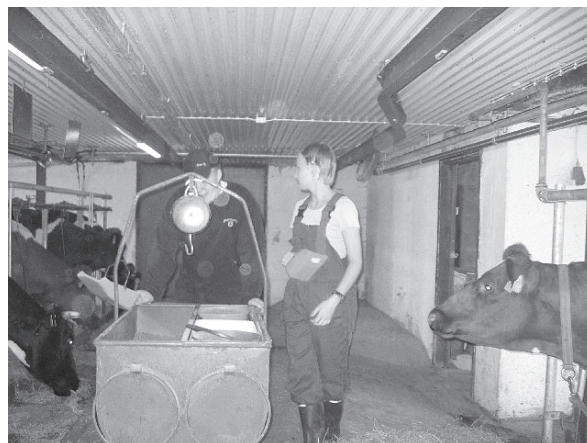
9-luokkalaista töissä navetassa

Erilaisia toimintamuotoja maaseutuammattien markkinoimiseksi kouluissa kokeiltiin. Kiuruvedellä järjestettiin yhdelle yläkoulun 9-luokalle maatilailtapäivä, jossa nuoret osallistuivat tiloilla navettatöihin. Opinto-ohjaajille järjestettiin lokakuussa tutustumisretki nykyaikaiselle maatilalle ja maaseutuyrityksiin. Syksyn aikana kolme Savonia AMK:n opiskelijaa vieraili osana projektityön opintojaan yhdessä paikallisten tuottajien kanssa kahdella koululla.