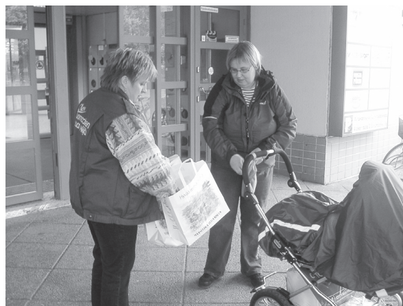
Suomalaisten maataloustuotteiden esittelyä Varkaudessa 30.9.

Maaseutunuoret olivat mukana valtakunnallisessa K- Citymarketeissa pidetyissä kauppatapahtumissa. Pohjois-Savon kauppatapahtuma oli 30.9. Tapahtuman tavoitteena oli kutsua kuluttajat tutustumaan suomalaisiin tuotteisiin ja pienyritysten ainutlaatuisiin herkkuihin. Tapahtumat liittyivät valtakunnalliseen Suomalainen K-Citymarket -kampanjaan, joka järjestettiin yhteistyössä suomalaisen elintarvikeketjun ja kotimaisuutta edustavien järjestöjen kanssa. Pohjois-Savossa Maaseutunuoret olivat mukana Varkauden, Kuopion ja Iisalmen Citymarketeissa.