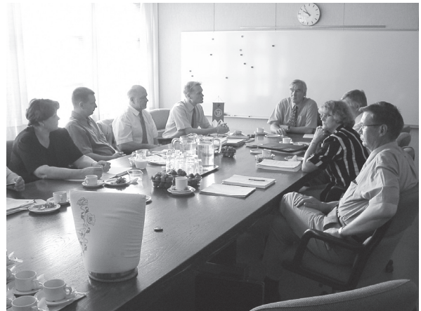
MTK-Liiton johtokunta kesäkokouksessa Suonenjoella.