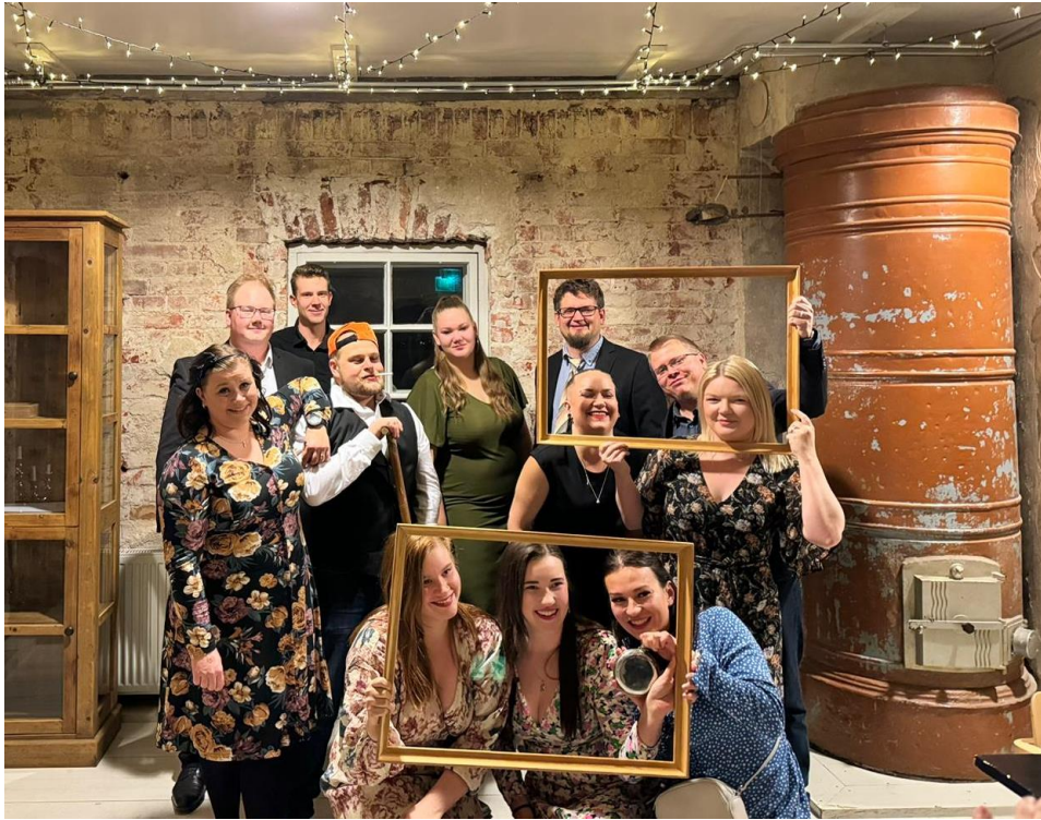
Pohjois-Savon maaseutunuorten edustus Syysparlamentissa Lappeenrannassa.

”jotta jatkuvuus yli sukupolvien ja avoimuuden lisääntyminen toteutuisi jatkossa. Tähän tulee tarttua välittömästi järjestöremontin yhteydessä. Maaseutunuoret ovat ensimmäinen kosketus MTK:n toimintaan.”