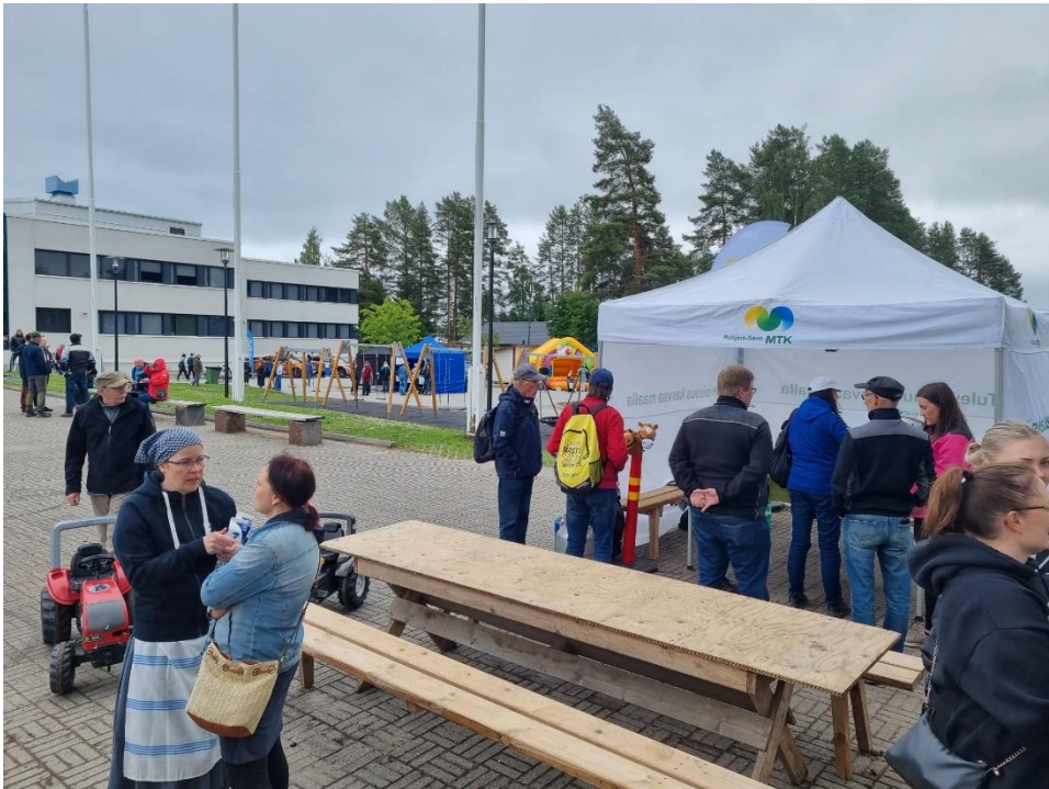
Eukonkantojen ohessa olevan Pitäjänmarkkinan tunnelmia.

MTK-Pohjois-Savon työpanosta hyödynnettiin muutamissa yhdistyksen kesätapahtumissa. Liitolta Krista oli mukana kesällä Sonkajärvellä Eukonkannoissa mukana. MTK-Sonkajärvi oli järjestänyt hienoa tapahtumaa Pitäjänmarkkinoille.