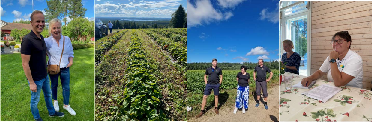
Kuvat 5–8. Kuvia Suonenjoen kesäpäivältä.

Elokuussa osallistuimme perinteisesti Kuopion torilla järjestettäviin Elonkorjuujuhliin sekä Kivennavan metsäiltamiin. Lisäksi elokuussa oli järjestöasiantuntijoiden koulutus Porissa. Elokuussa pidettiin myös kansanedustajatapaaminen Savo-Karjalan kansanedustajille, jonka järjesti liiton kanssa yhteistyössä MTK-Suonenjoki. Vierailimme Suonenjoella Maitomaan ja Pakkasmarjan tehtaalla sekä Soirion marjatilalla. Tapahtumaan kutsuimme mukaan myös europarlamentaarikko Elsi Kataisen.