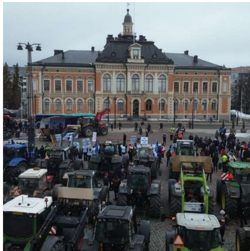
Kuva 1 ja 2. Traktorimarssin väkijoukkoa.