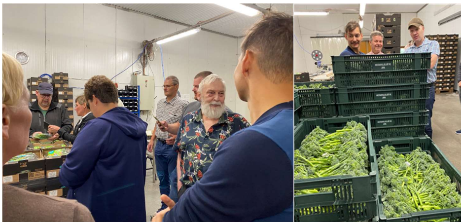
Kuvat Erikoiskasvialiokunnan vierailu Torvisen tilalla.