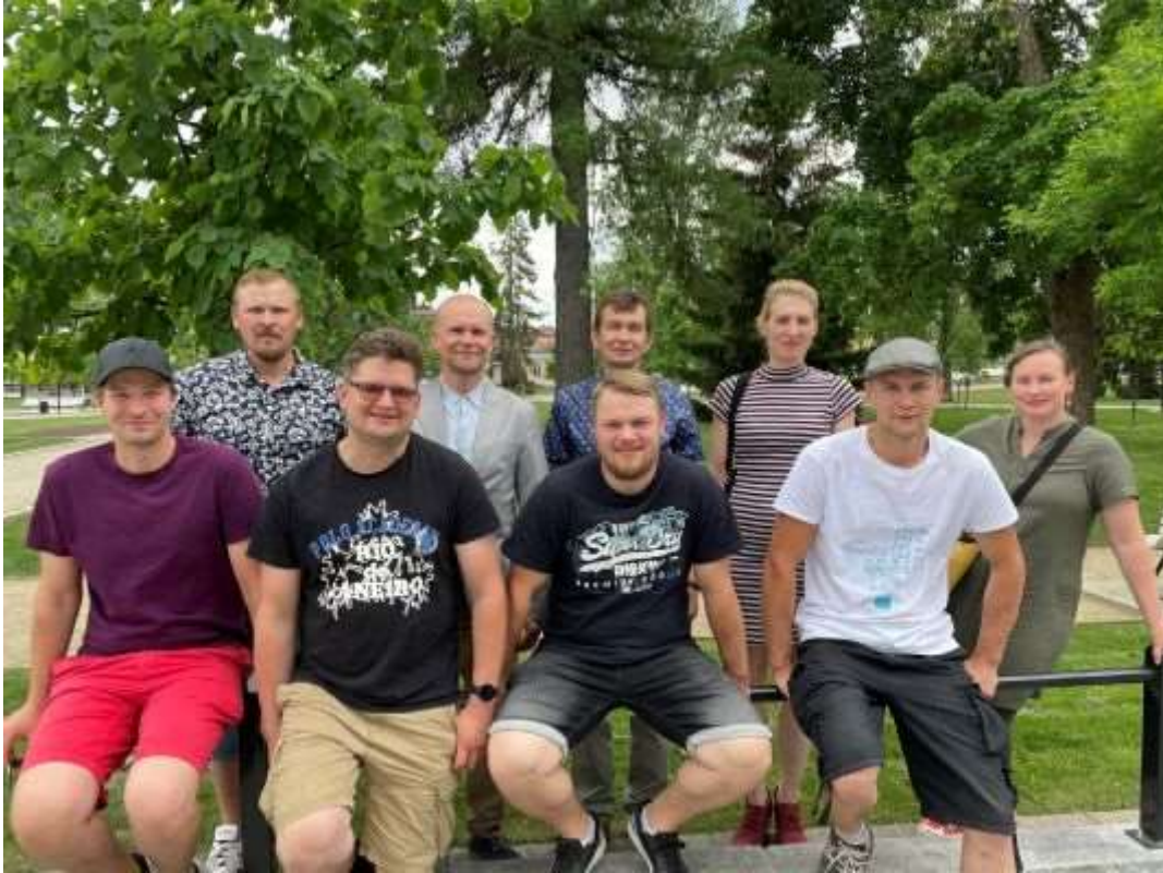
Kuvassa johtokunnan jäsenet kesäkuussa 2024