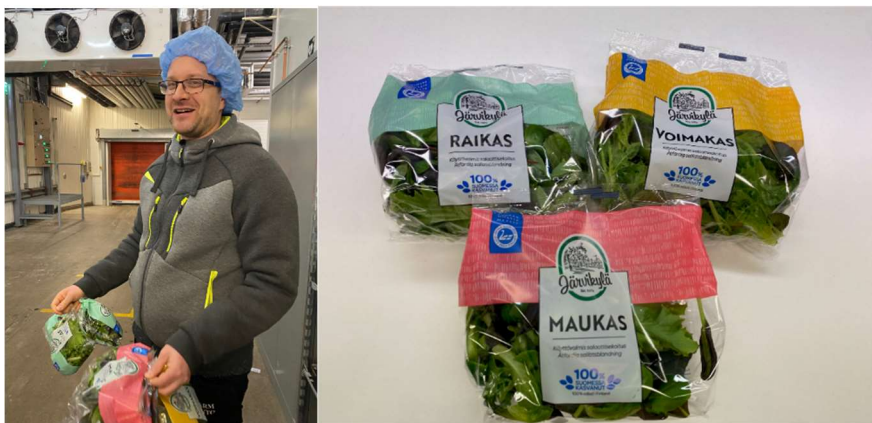
Kuvia Järvikylän yritysvierailulta.