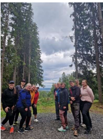
Kuva 9. IKS toimihenkilöt Puijolla.

Itä- ja Keski-Suomen (IKS) toimihenkilöt kokoontuivat toimihenkilöpäiville Kuopioon elokuussa 2024. Toimihenkilöpäivillä suunniteltiin yhteisiä tulevia tapahtumia. Puijon upeat maastot tarjosivat virkistätymismahdollisuuden toimihenkilöille.