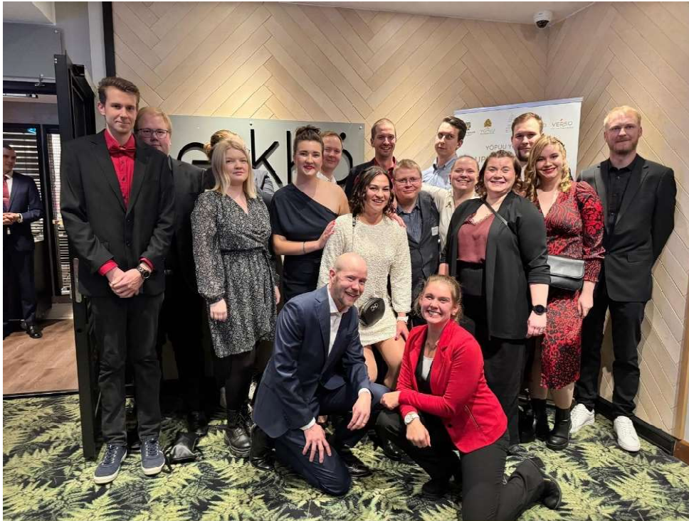
Pohjois-Savon maaseutunuorten edustus Syysparlamentissa Jyväskylässä. Kuvassa on kaksi eteläsavolaista.

”jotta jatkuvuus yli sukupolvien ja avoimuuden lisääntyminen toteutuisi jatkossa. Tähän tulee tarttua välittömästi järjestöremontin yhteydessä. Maaseutunuoret ovat ensimmäinen kosketus MTK:n toimintaan.”