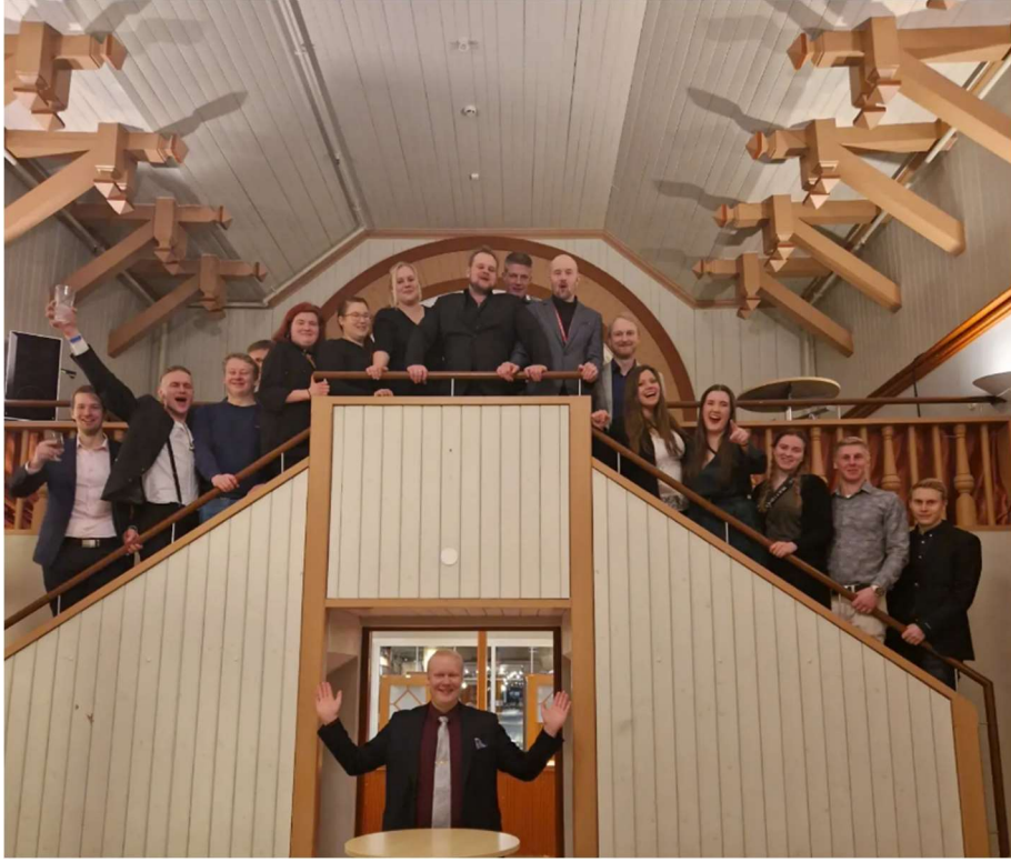
Itä- ja Keski-Suomen puheenjohtaja-sihteeripäivillä Savonlinnassa maaseutunuoria.