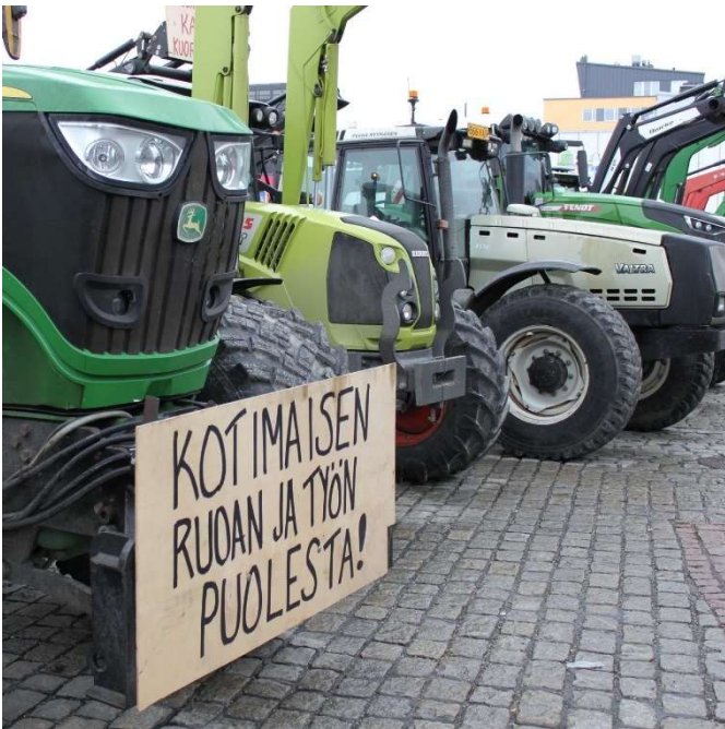
Kuva 3. Traktoreihin oli kiinnitetty näyttäviä kylttejä.