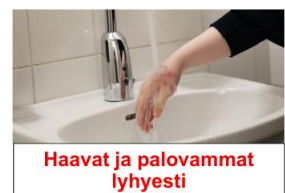
Haavat ja palovammat lyhyesti

© Punainen Risti Ensiapu 2024. All rights reserved.