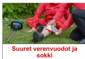
Suuret verenvuodot ja sokki