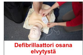
Defibrillaattori osana elvytystä