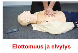
Elottomuus ja elvytys